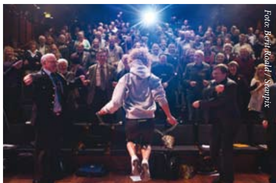
Fra Språkdagen 2010 i Oslo Konserthus.

Da St.meld. nr. 35 (2007–2008) Mål og mening ble behandlet i Stortinget våren 2009, var det for første gang på